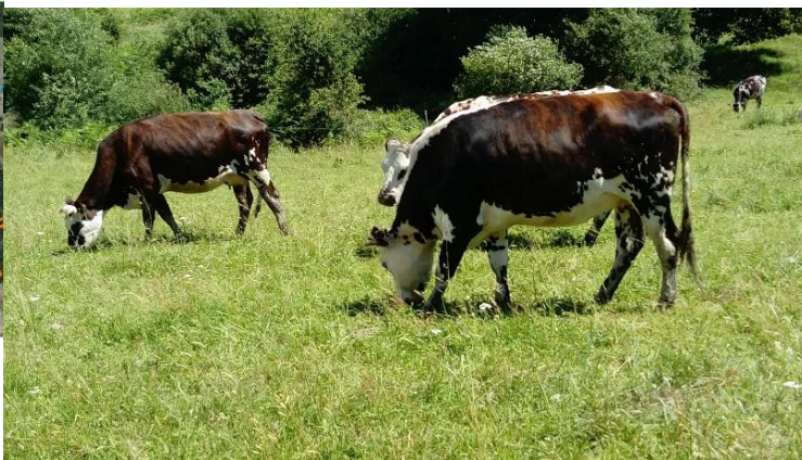
Baignes Sainte Radegonde (16)

Nombre de places et prérequis : 10 places sont disponibles pour des éleveur(euse)s motivé(e)s des Pyrénées Atlantiques, Hautes Pyrénées et Landes. Pas de prérequis. Durée de la formation : 21 heures